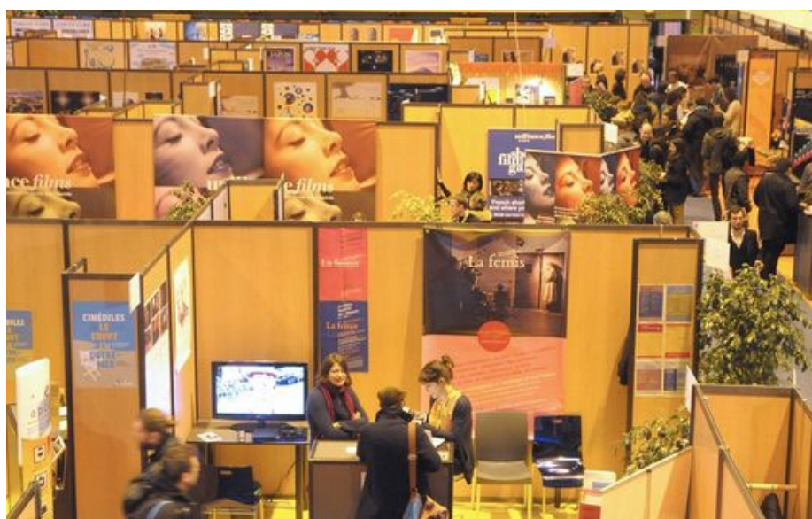
El Marché du Film Court de Clermont – Ferrand

http://www.mediafrance.eu/Euro-Connection-Forum-Europeen-de.html