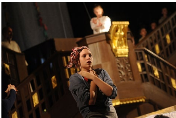
Imagen de un momento del estreno de Noye's Fludde

La ópera Noye's Fludde de Benjamin Britten cuenta la historia de la construcción del Arca de Noé. La partitura está sustentada sobre himnos protestantes, y está compuesta para ser interpretada por una mezcla de músicos profesionales y amateurs, cumpliendo así la voluntad de Britten de aunar la música académica, la música tradicional de