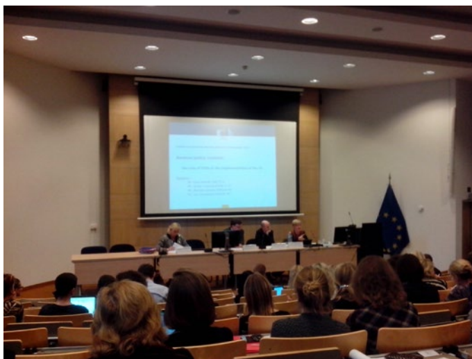
Sari Vartiainen, directora de la Unidad MEDIA para educación, audiovisual y cultura, durante las jornadas

El nuevo programa EUROPA CREATIVA integrará, aunque de manera diferenciada, los hasta ahora denominados Programas MEDIA y Programa Cultura. Además y como novedad, la Comisión Europea prevé la descentralización de la gestión de las convocatorias a nivel nacional, a través de oficinas especializadas del Programa EUROPA CREATIVA en cada uno de los países miembros, que trabajarán en estrecha relación con las ya existentes oficinas de ANTENA MEDIA, que se convertirán en las oficinas EUROPA CREATIVA MEDIA .