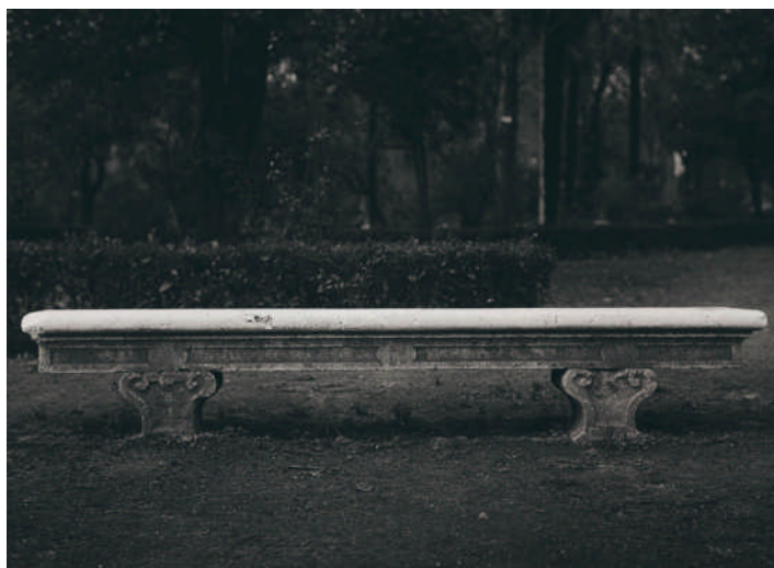
Banco en el Jardín Botánico, Madrid, 1958