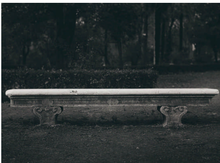
Paco Gómez. Foto Colectania. Banco en el Jardín Botánico, Madrid, 1958

Paco Gómez. Orden y desorden es la primera gran retrospectiva dedicada a este fotógrafo tras su muerte, ocurrida en 1998. El objetivo está claro: es una muestra definitiva para el conocimiento y valoración de quien realizó algunas de las imágenes más poéticas de la España de la posguerra. Su comisaria, Laura Terré, lo explica con estas palabras: “Se trata de un autor de gusto ortogonal (...). Se sitúa de frente y equilibra los límites del formato, excluye lo superfluo, busca los ejes que tensen el espacio y dispara”. La sencillez ante todo, pero también el silencio y la austeridad son la base sobre la que trabajó Gómez.