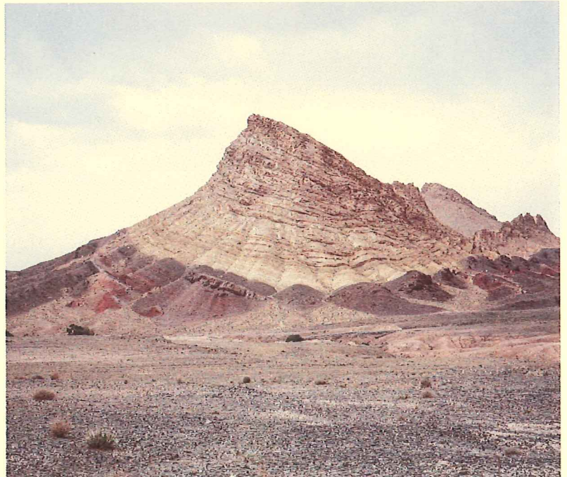
© Manolo Espaliú. Sin título , 2016.

The project Trip to Persia has been developed thanks to the scholarship ART-EX awarded by the MAEC-AECID.