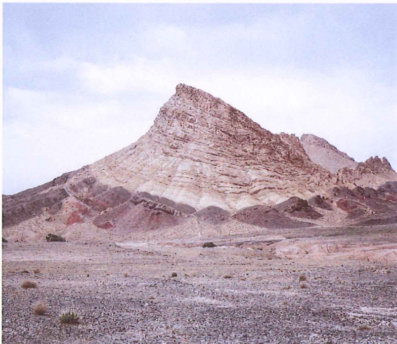
© Manolo Espaliú. Sin título , 2016.

El proyecto Viaje a Persia ha sido desarrollado gracias a beca ART-EX de MAEC-AECID