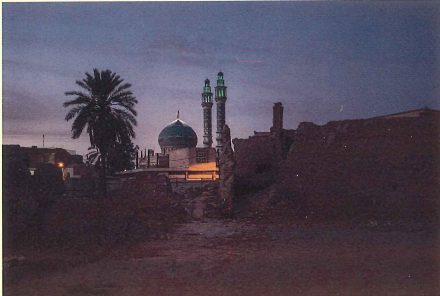
© Manolo Espaliú. Sin título , 2016.

Andalusian Centre of Photography 26 January to 18 March 2018