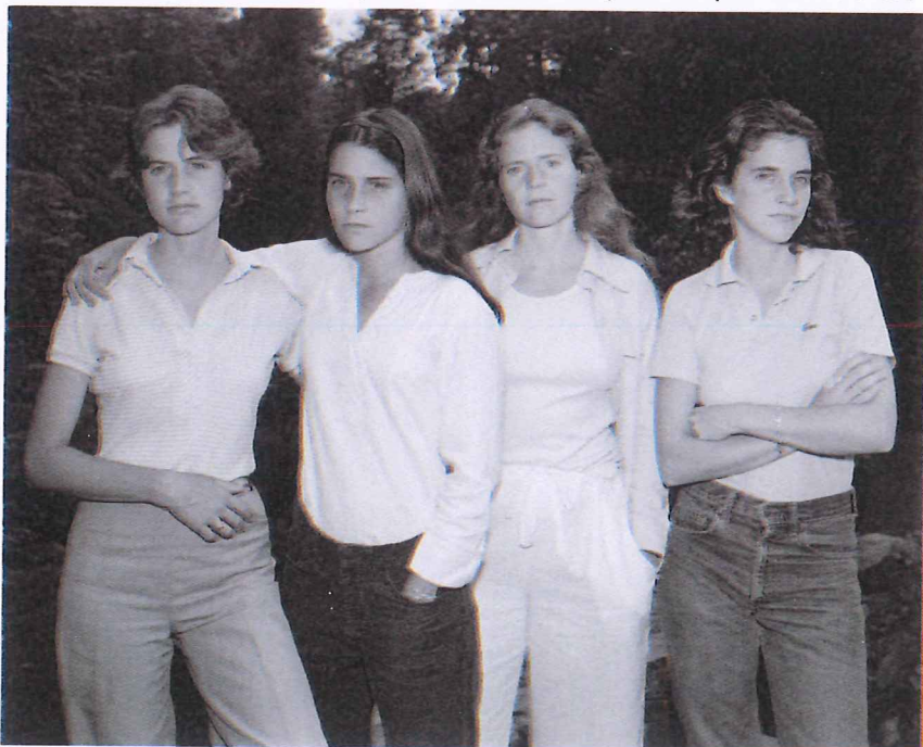
© Nicholas Nixon. The Brown Sisters , 1975. Cortesía Fraenkel Gallery, San Francisco.

Calle Pintor Díaz Molina nº 9. 04002 Almería / Telf.: 950 186 360 / caf.ccul@juntadeandalucia.es / www.centroandaluzdelafotografia.es Horario: de 11:00 a 14:00 h. y de 17:30 a 21:30 h. / Abierto de lunes a domingos. / Entrada libre.