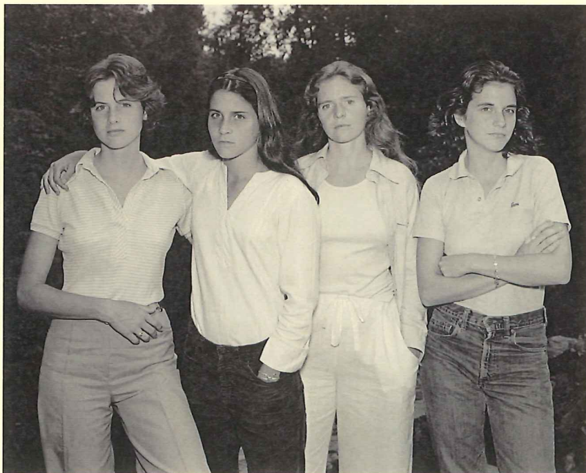
The Brown Sisters , 1975.

Calle Pintor Díaz Molina nº 9. 04002 Almería / Tel.: + (34) 950 186 360 / E-mail: caf.ccul@juntadeandalucia.es / www.centroandaluzdelafotografia.es Opening Hours: 11 to 2 and 5.30 to 21.30 / Open Mondays to Sundays / Free Admission.