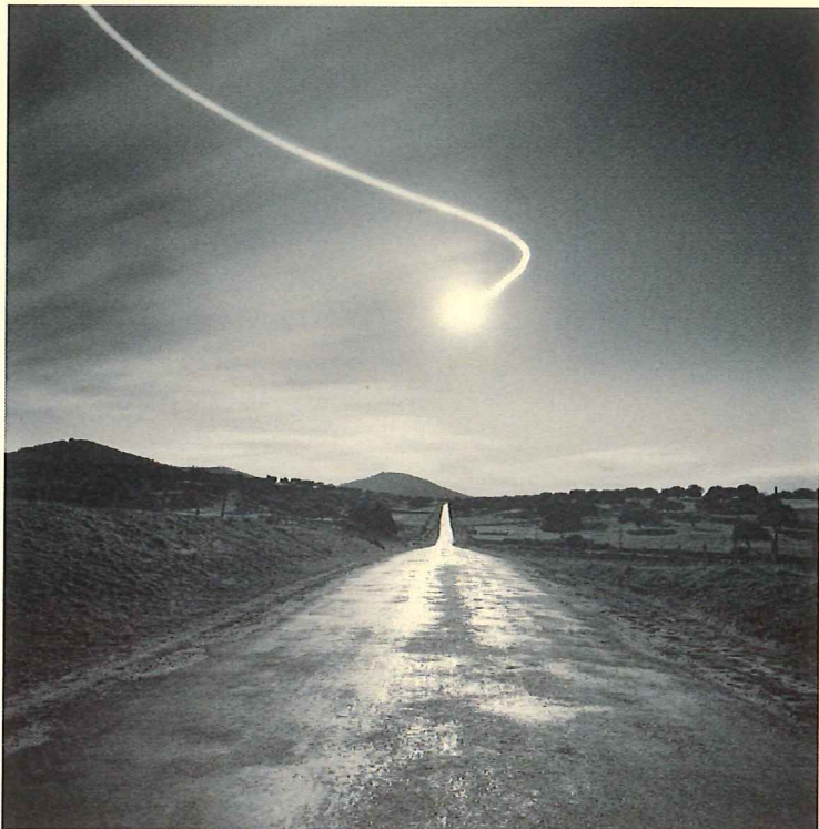
Carretera de Cespedosa, 1987.