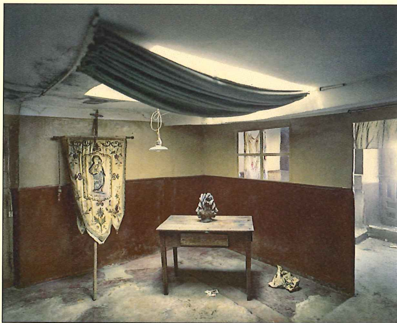
© Juan Manuel Castro Prieto. Estandarte , 2016.