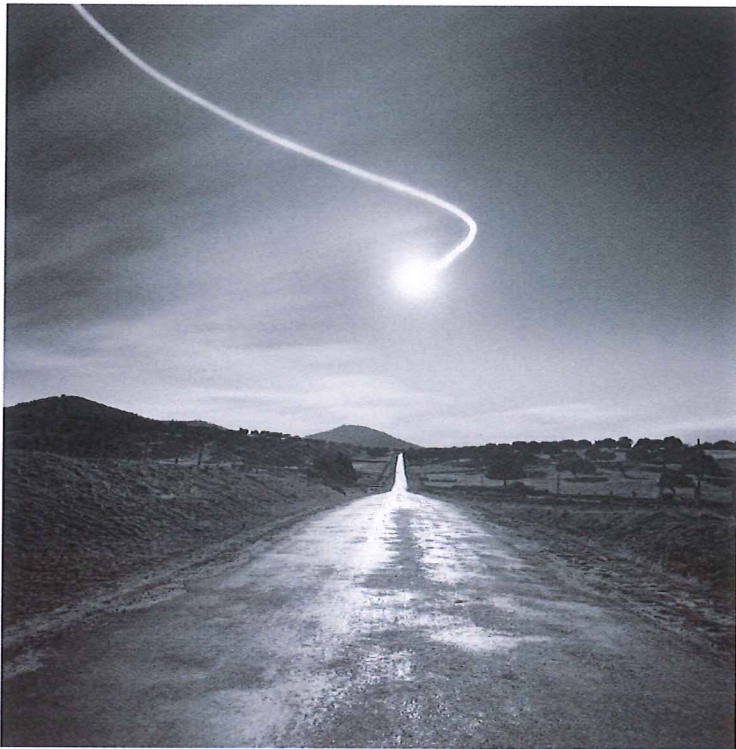
© Juan Manuel Castro Prieto. Carretera de Cespadosa , 1987.

Centro Andaluz de la Fotografía Del 13 de marzo al 14 de mayo de 2017