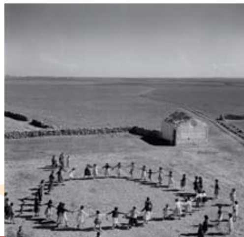
Corro de niñas, Argamasilla de Alba, Ciudad Real , 1957