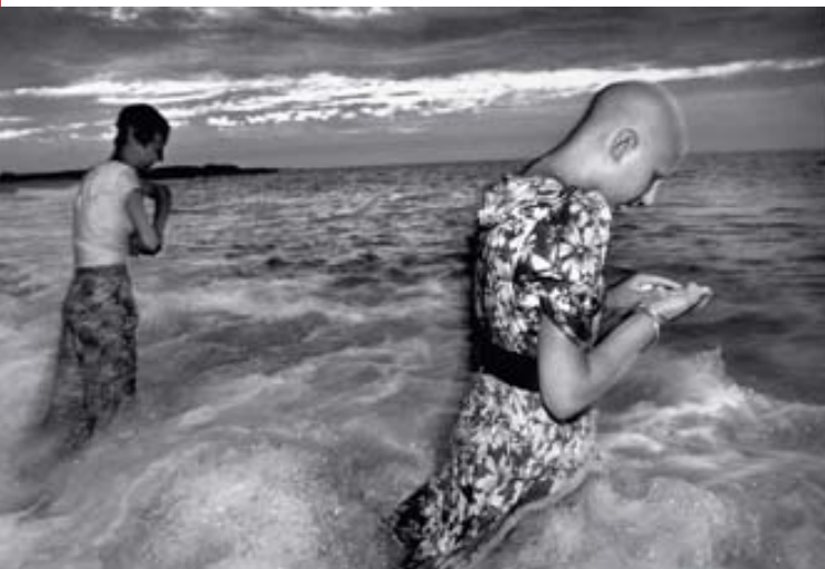
Ciudad de los pioneros, Tarara. Cuba , 1993

Las fotografías forman parte de la Colección Alcobendas, que reúne la obra de los mejores autores de la fotografía española y donde están representadas todas y cada una de las tendencias de la imagen creativa. Así, la exposición se compone de una cuidada selección de obras de 28 grandes autores.