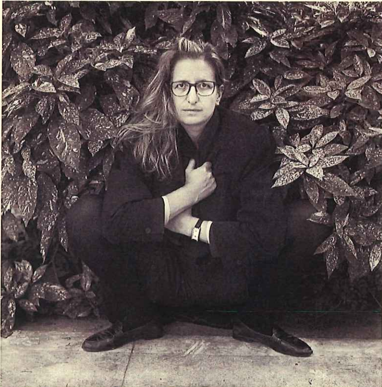
© Ricardo Martín. Annie Leibovitz. 1989

From October 11 to December 9, 2019 Showroom AFAL