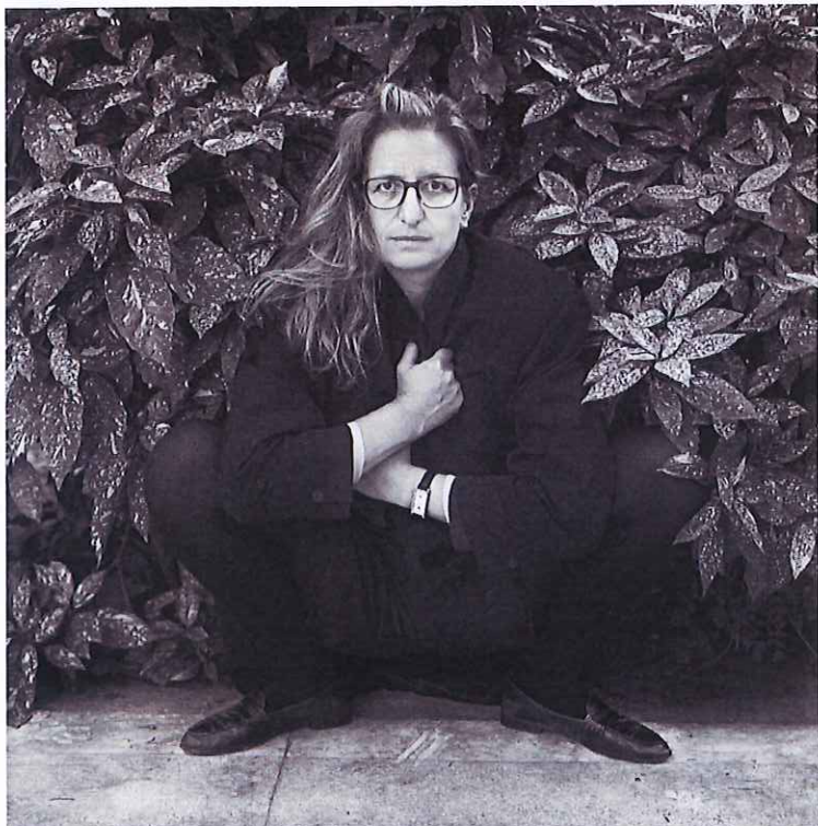
© Ricardo Martín. Annie Leibovitz. 1989

Del 11 de octubre al 9 de diciembre de 2019 Sala AFAL