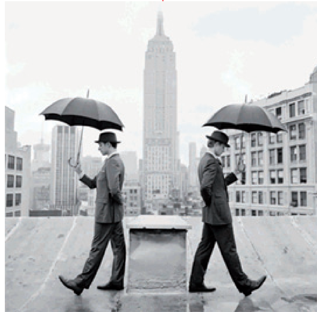
© Reed y Nathan con paraguas en azotea, Nueva York, NY 2011 © Reed and Nathan with Umbrellas on Rooftop, New York, NY 2011