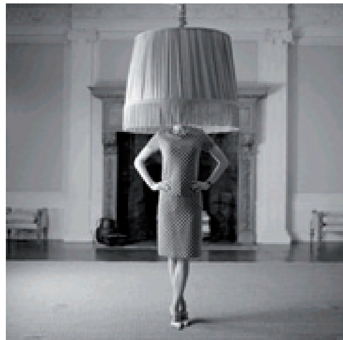
© Victoria bajo una lámpara, Rhinebeck, Nueva York, 2011 © Victoria Under Lampshade, Rhinebeck, New York 2011