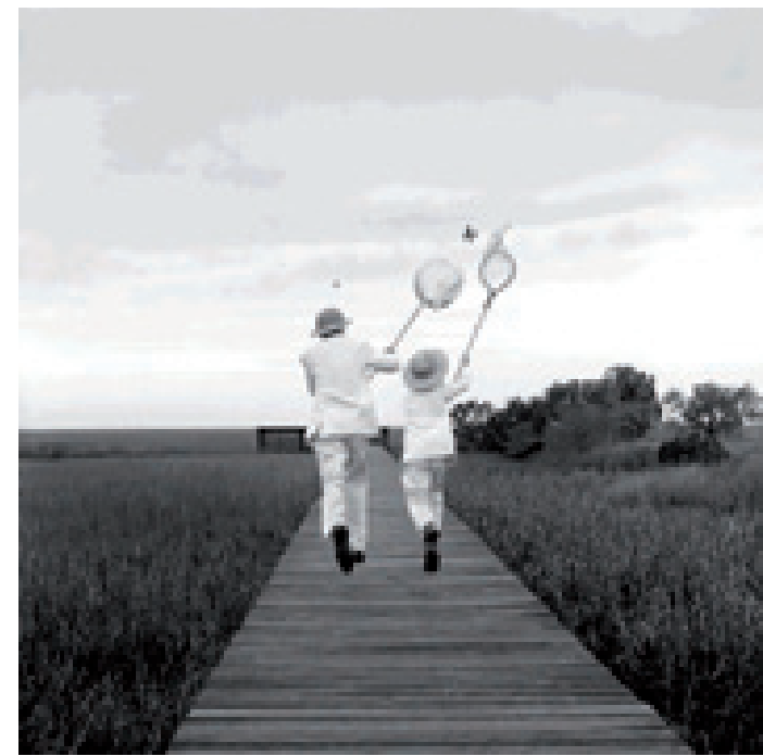
© Gary y Henry cazando mariposas. Beaufort, Carolina del Sur, 1996 © Gary and Henry Chasing Butterfly, Beaufort, SC, 1996