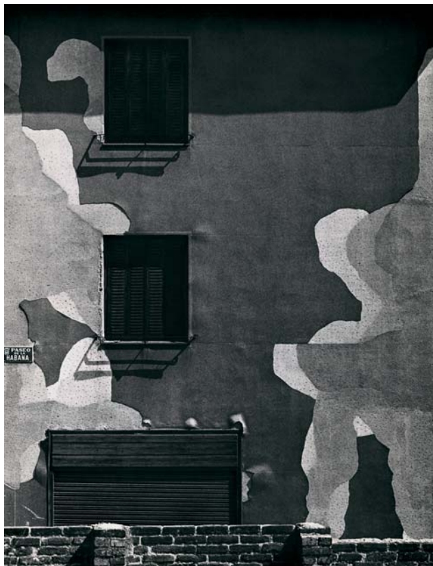
© Paco Gómez. Foto Colectania. Fachada en el Paseo de la Habana, Madrid, 1974.

La Fundación Foto Colectania, que custodia el archivo completo del fotógrafo, formado por 25.000 negativos y más de 1.000 fotografías, le rinde homenaje presentando la primera gran retrospectiva dedicada a este fotógrafo tras su muerte en 1998, titulada Paco Gómez. Orden y desorden. El objetivo: configurar una muestra definitiva para el conocimiento y valoración de quien realizó algunas de las imágenes más poéticas de la España de la posguerra. Su comisaria, Laura Terré, lo explica con estas palabras: "Se trata de un autor de gusto ortogonal (...). Se sitúa de frente y equilibra los