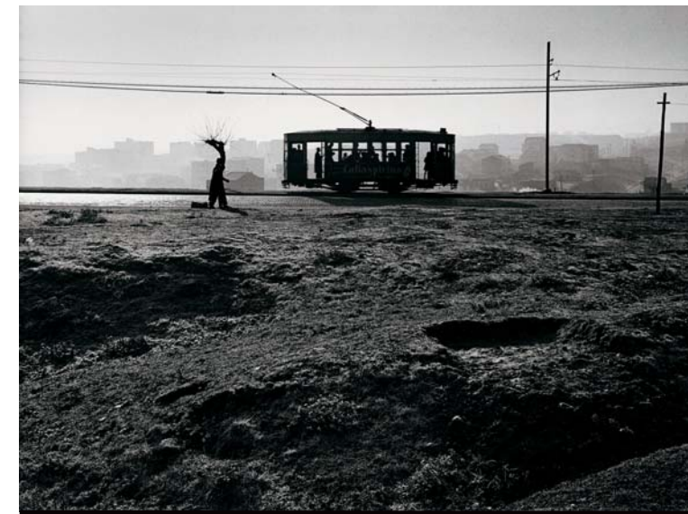
Centro Andaluz de la Fotografía

between 1957 and 1995. These black and white images, together with the colour ones taken from the eighties on, present an artist who is noted by his particular way of understanding photography.