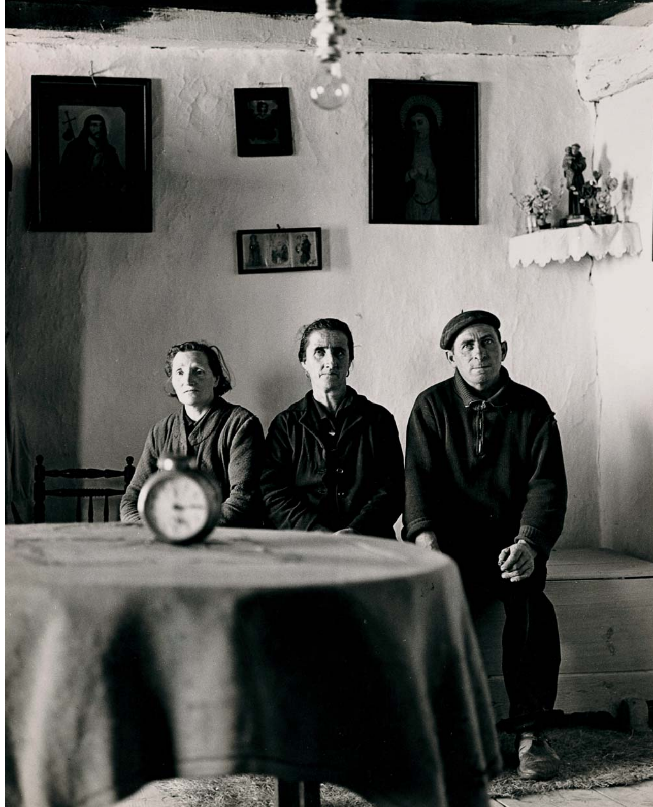
© Paco Gómez. Foto Colectania. Familia de Turégano, 1959.

"indiscutibles obras maestras" de Gómez entre 1957 y 1995. Imágenes realizadas en blanco y negro y, ya a partir de los años ochenta, en color y que presentan a un artista que destacaba por su particular modo de entender la fotografía.