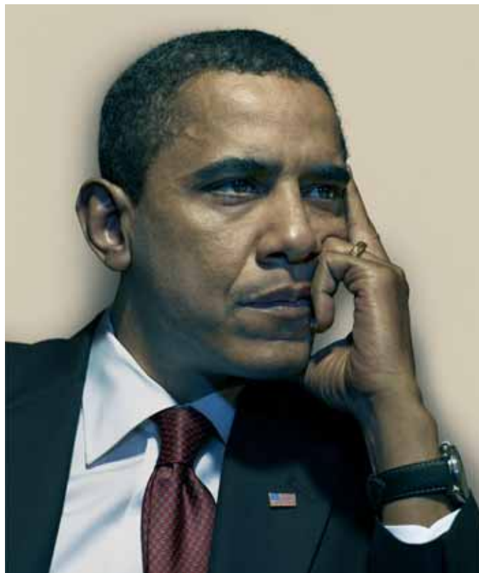
Barack Obama II, 2009 © Nadav Kander

Obama's People and Other Portraits e Inner Condition son los títulos de las dos exposiciones sobre el reconocido fotógrafo Nadav Kander, afincado en Londres. La muestra consta del retrato del propio Obama y de su equipo, realizados antes de que fuera nombrado presidente de Estados Unidos, así como una serie de retratos de artistas y otras celebridades como Brad Pitt, Henry Kissinger o David Lynch, junto a una inédita y personal obra de desnudos que se presenta en exclusiva.