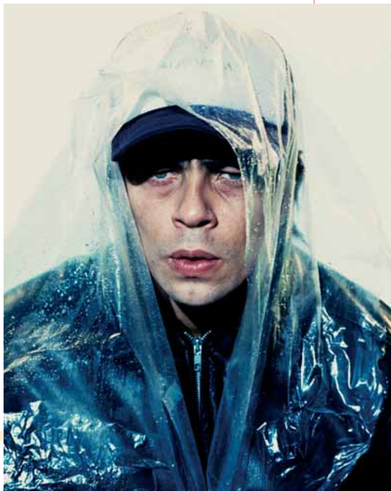
Benicio del Toro, 2000

Obama's People was commissioned by The New York Times to reflect the character and personality of the