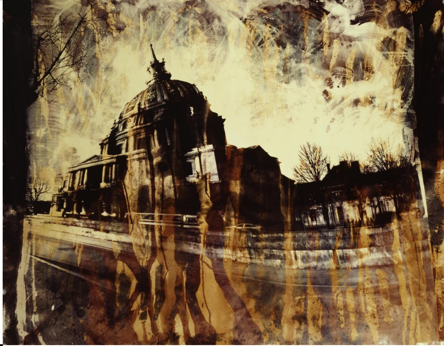
Hotel des Invalides, 1999